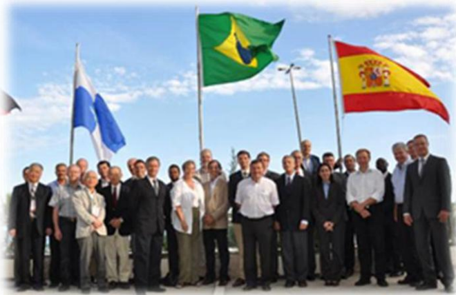
Reunião dos Secretários das Associações Nacionais e Regionais de Sementes