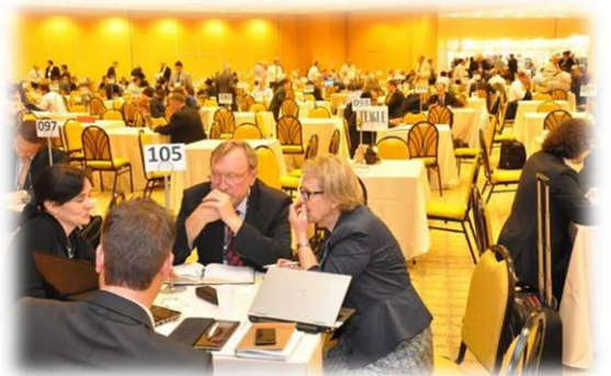
Salão de negócios