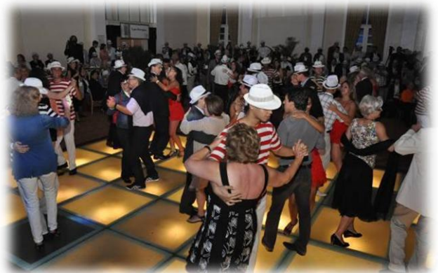
Dançarinos profissionais de samba ensinando suas habilidades