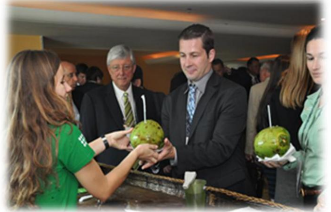
Refresco servido após a cerimônia de abertura