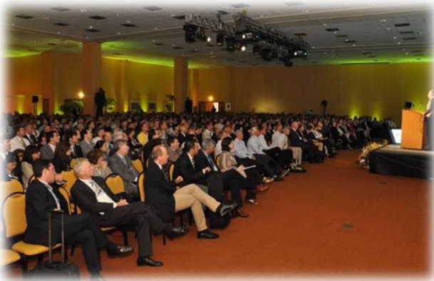
Cerimônia de abertura Windsor Barra Centro de Convenções