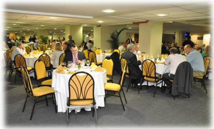
Área de almoço