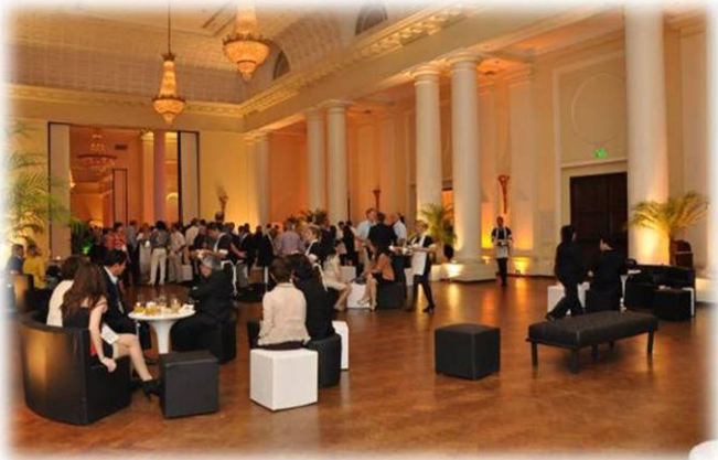
Copacabana Palace O local majestoso da Festa de Boas Vindas