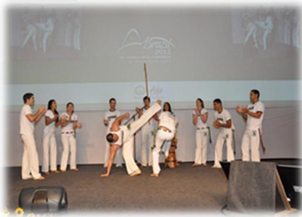
Apresentação de capoeira