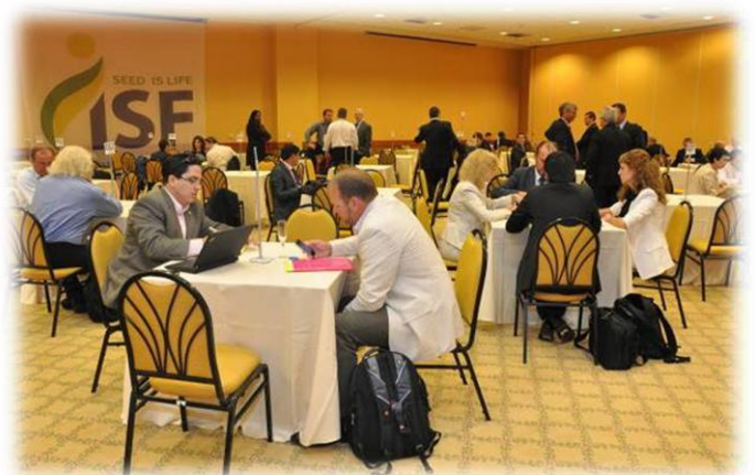
Salão de negócios