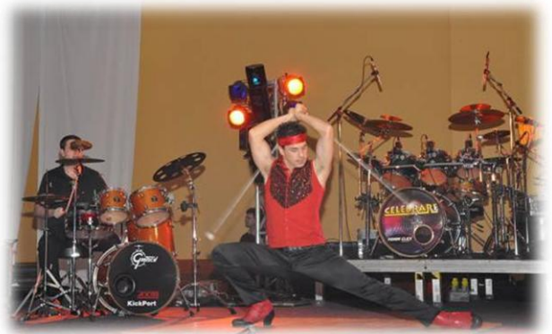
Entretenimento durante o jantar de gala