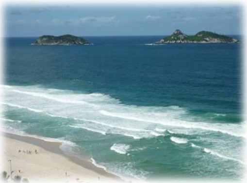
Local do Congresso: Windsor Barra Hotel & Centro de Convenções