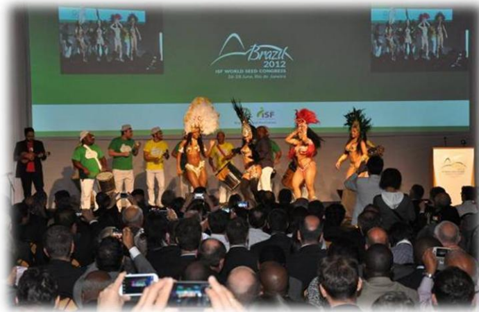
Samba e dançarinos