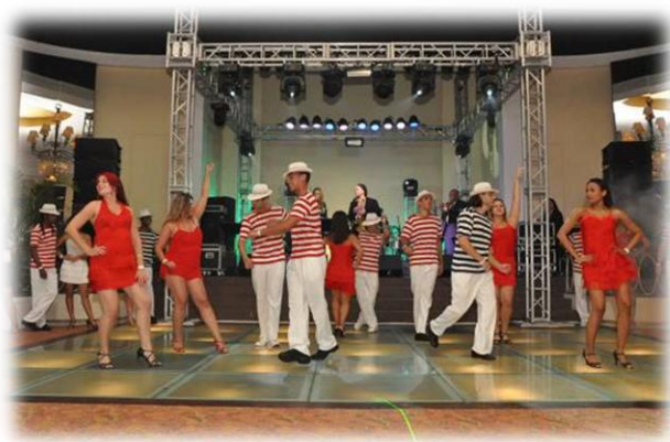
Dançarinos de Samba de Gafieira