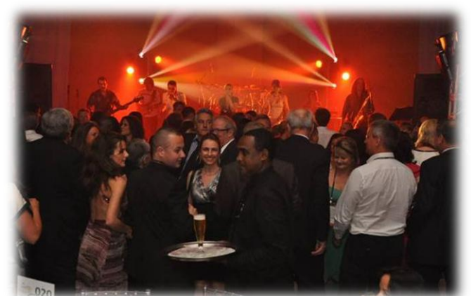
Membros do ISF dançando até o amanhecer.