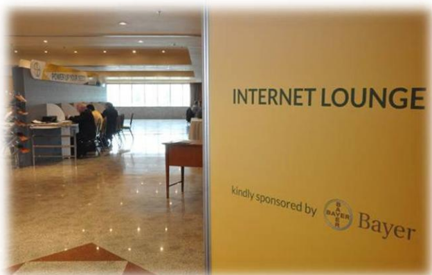
Salão de Internet