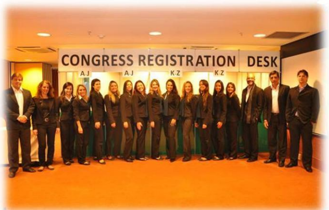
Equipe de Inscrição