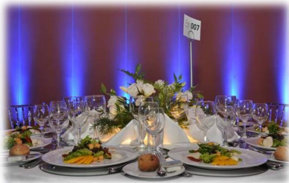
Belíssimas mesas para o jantar de gala