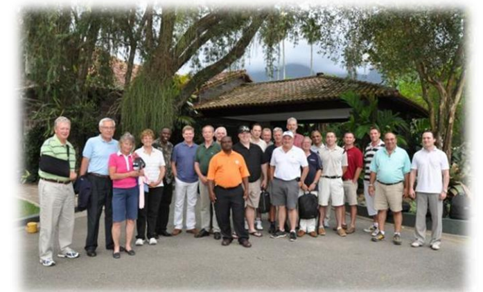
Torneio de golfe no Itanhangá Golf Club