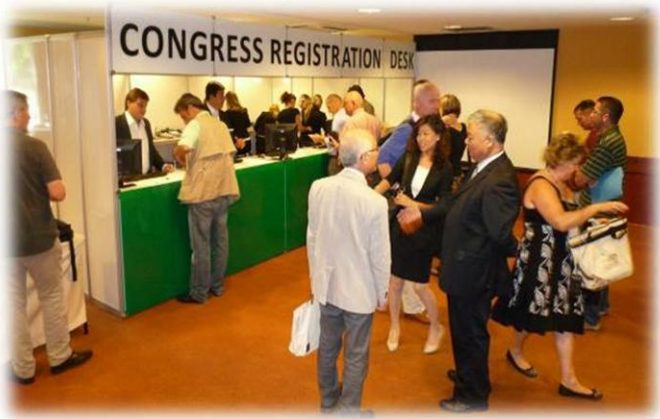
Registro dos participantes