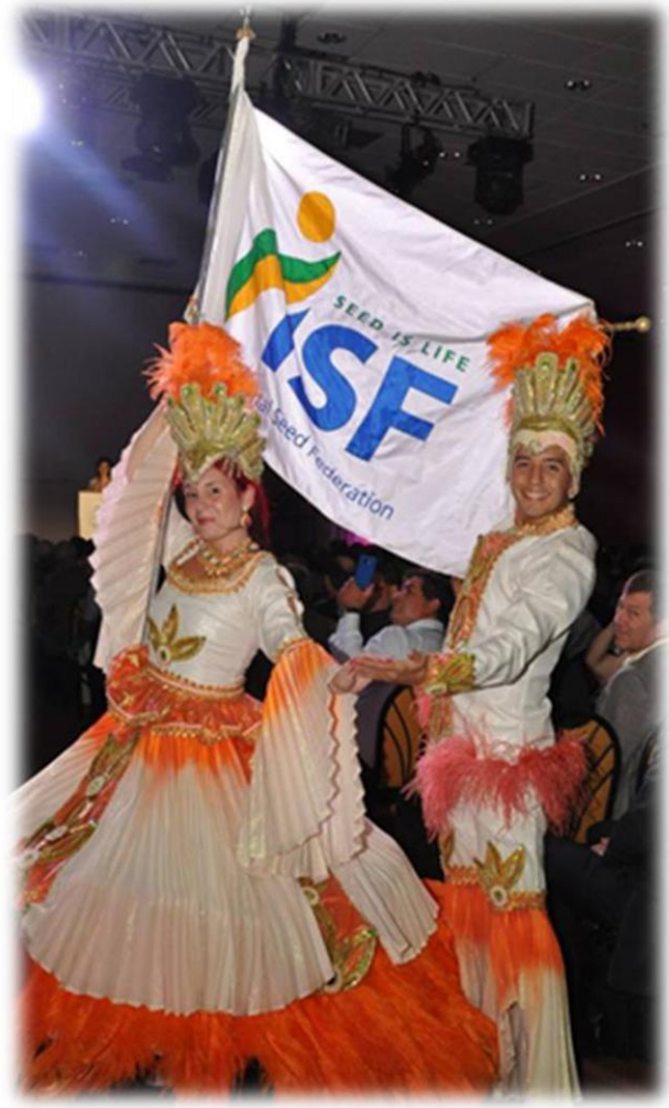
Dançarinos brasileiros carregando a bandeira da ISF