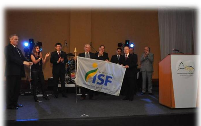
Transferência da bandeira da ISF para a delegação grega que sediará o Congresso Mundial de Sementes 2013, em Atenas.