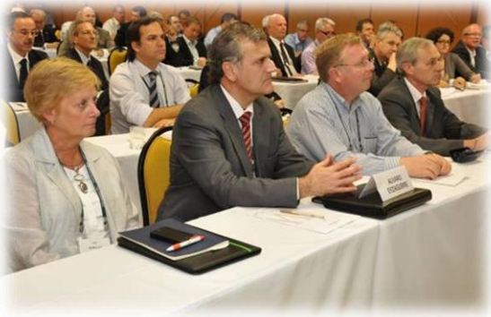
Momento emocionante, todas as propostas serão adotadas?